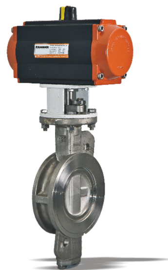
Metalltätande vridspjäll med vridon